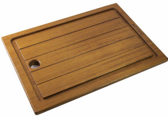
Schneidebrett aus Iroko-Holz 8643 117